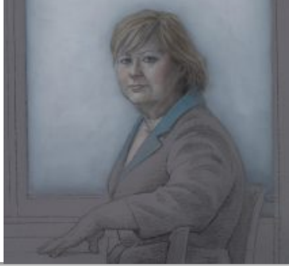
4 - 2016